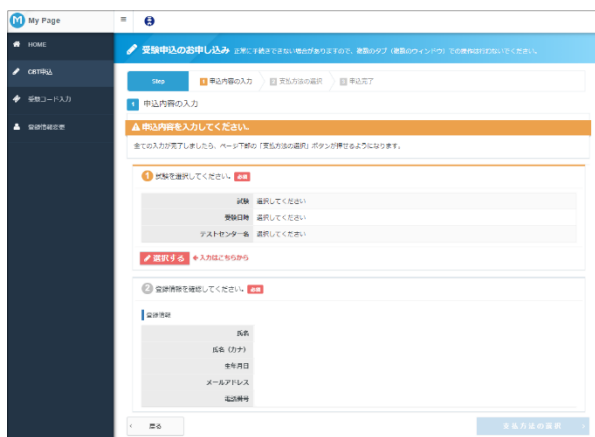
(申込内容入力画面)