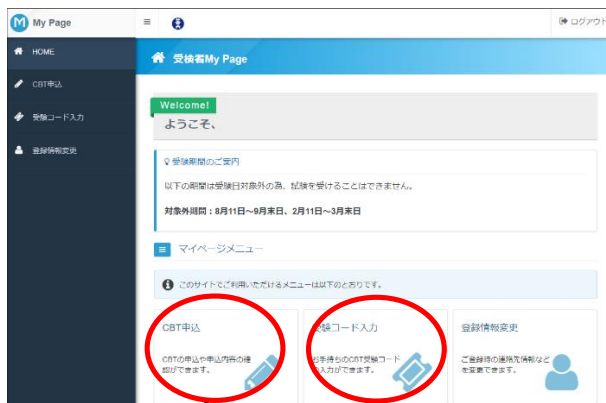
(CBT 試験 MyPage 画面)

CBT 試験の MyPage にログイン出来たら、受験コードを入力後、CBT 申込より予約する科目と場所を選択し、予約可能な時間帯から試験時間を選択して試験を予約することができます。