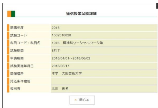
(通信授業試験詳細画面(PC))