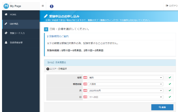
(日程・会場選択画面)