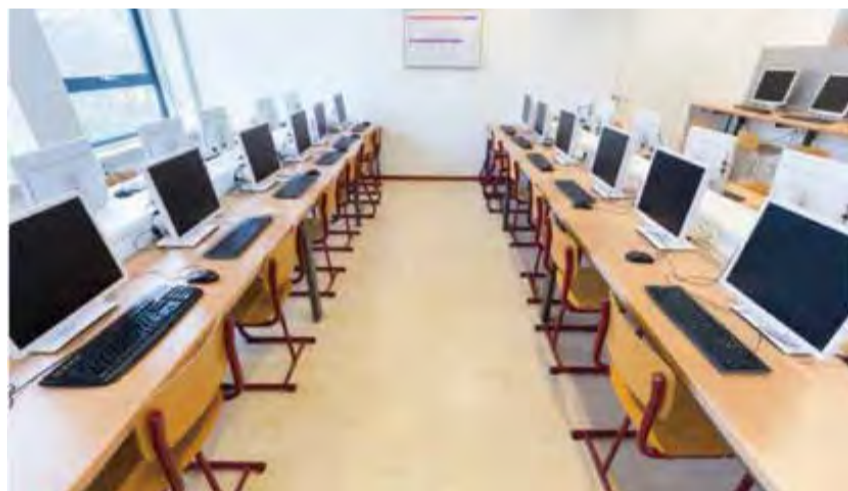
※会場写真はイメージです。